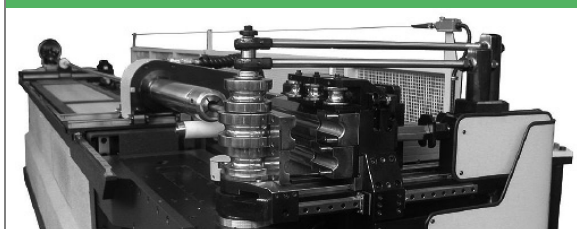
PROVAR 6 U-D