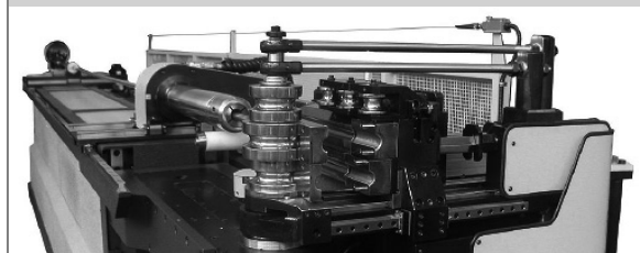
PROVAR 6 U-D